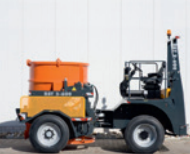
2600 BST Betondumper