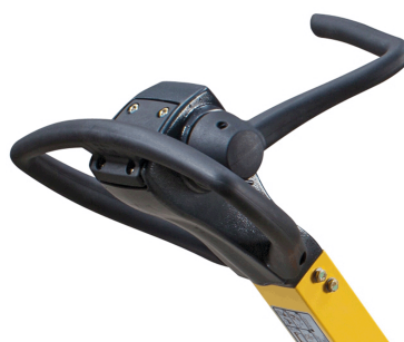
Präzise und sicher bedienbar BOMAG Ein-Hebel-Steuerung